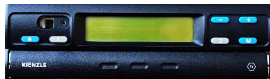
Typ 1324/27 EVO-Bus