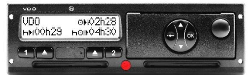
Typ 1381 DTCO 2.1