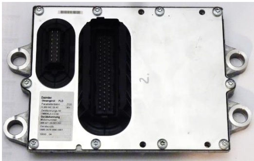
MB CITARO Motorsteuergerät