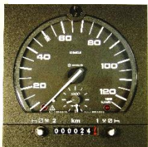
Typ 1318/27 SETRA