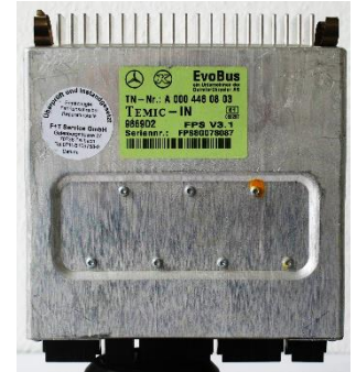
FPS – Steuerung